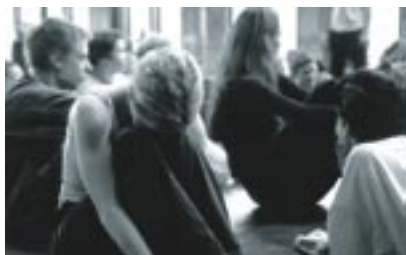
Pause während einer Durchlaufprobe, Arena

Am Sacre-Tanzprojekt hat die gesamte dreizügige sechste Jahrgangsstufe der Lenau-Grundschule teilgenommen. Sie besteht im Schuljahr 2002/03 aus 23