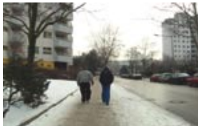
Märkisches Viertel, Berlin

TG Ein anderer wesentlicher Aspekt ist die Aufnahmetechnik. Der Ton in den Workshops wurde auf vier Tonspuren aufgezeichnet, zusätzlich haben wir 6.1 Surround Atmos