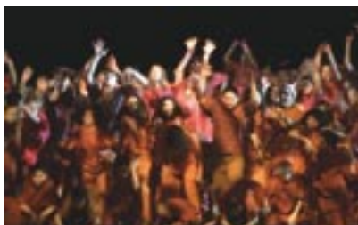
Durchlaufprobe mit Kostümen, Arena

ESL Ohne die Nähe zu den Beteiligten hätten wir nicht an diesem Prozess teilhaben können. Die notwendige Distanz entsteht zwischen den Drehs und in der Auswertung.