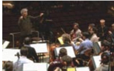
Berliner Philharmonie, Probe in Anwesenheit der Tänzer und Tänzerinnen