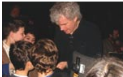
Simon Rattle und Kinder, nach der Aufführung von Le Sacre du Printemps

Während die Teilnehmer in der ersten Phase des Projekts jeweils nur einen Teil von Le Sacre du Printemps kennengelernt hatten, kam es in der Arena zu einer Begegnung mit dem gesamten Werk. Bereits am zweiten gemeinsamen Probentag besuchte Simon Rattle eine Durchlaufprobe in der Arena und zeigte sich äußerst beeindruckt von der Arbeit. Am 24. Januar 2003 kamen dann die Tänzerinnen und Tänzer in die Philharmonie, um das Orchester bei einer Sacre -Probe zu