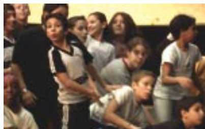
Hannah Höch Grundschule, Berlin Reinickendorf