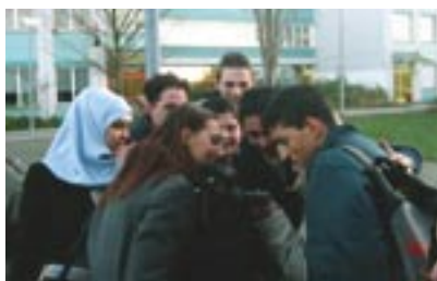
Mustersichtung auf dem Schulhof der Heinrich Mann Oberschule, Berlin Buckow

Zukunft@BPhil ist die Initiative der Berliner Philharmoniker, um die Arbeit des Orchesters und seine Musik einem möglichst breiten Publikum zugänglich zu machen. Hierbei sollen Menschen aller Altersstufen, unterschiedlicher sozialer und kultureller Herkunft und Begabungen für eine aktive und schöpferische