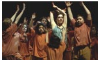
Durchlaufprobe in Kostümen, Arena

TG Das ganze Projekt konnte nur durch Vertrauen von allen Seiten funktionieren: Vertrauen in ein Projekt ohne Drehbuch, in einen Prozess mit offenem Ausgang. Das