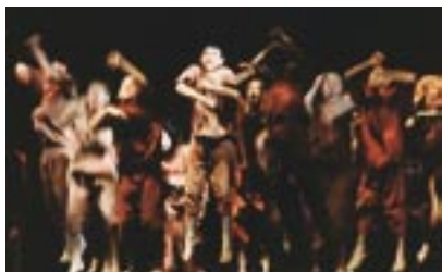
Generalprobe mit Kostümen

Ich habe keine Erwartungen. Es würde sonst etwas ganz anderes entstehen. Die jungen Leute, die ich bisher kennengelernt habe, sind großartig. Ich freue mich besonders darauf, in einigen der Schulen zu arbeiten.