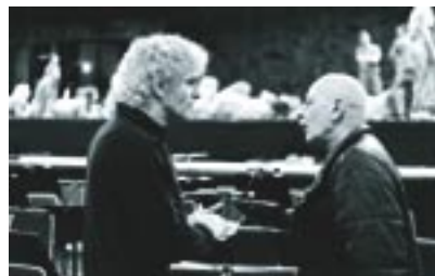
Sir Simon Rattle und Royston Maldoom

Ich gehe rein und sage: Es gibt keinen Plan. Ich dirigiere die Choreographie sehr stark, aber es geht erst in dem Moment los, wenn ich im Raum bin, mit den Leuten. Es hängt davon ab, ob die Sonne scheint, ob es regnet... Es ist unmöglich vorauszusagen, wie die Teilnehmer sein werden. Wir werden einfach reingehen, ein warm-up machen. Und ich werde viel am “focus” arbeiten. Einen großen Teil der Arbeit verwende ich darauf, die Leute dazu zu bekommen, sich auf sich selbst zu fokussieren und die Stille zu finden. Das Geheimnis des Tanzes ist die Stille. Auch die Musik beginnt mit der Stille. Wenn