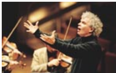
Sir Simon Rattle, Orchesterprobe

allen Räumen angefertigt. Die Aufnahmen mit den Berliner Philharmonikern und die Score Aufnahmen wurden in 5.1 Surround Qualität aufgenommen und der gesamte Film als 5.1 Surround Erlebnis in Dolby Digital gemischt. Das ist ein extrem aufwendiges, aber tolles Verfahren, weil es die Musik im Kinosaal physisch fühlbar macht und die Zuschauer immer mitten im Geschehen sein lässt.