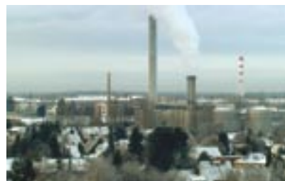
Blick über Berlin

Der emotionale Drive, den die Regisseure in jeder Szene einzufangen verstehen, macht RHYTHM IS IT! zu einem der besten Filme über kreative Prozesse. Simon Rattles zu Royston Maldoom geflüsterter Kommentar bringt es auf den Punkt: 'It's fucking unbelievable!' Applaus Kulturmagazin