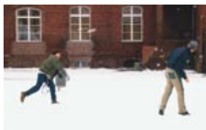
Heinz Brandt Oberschule, Berlin Weißensee