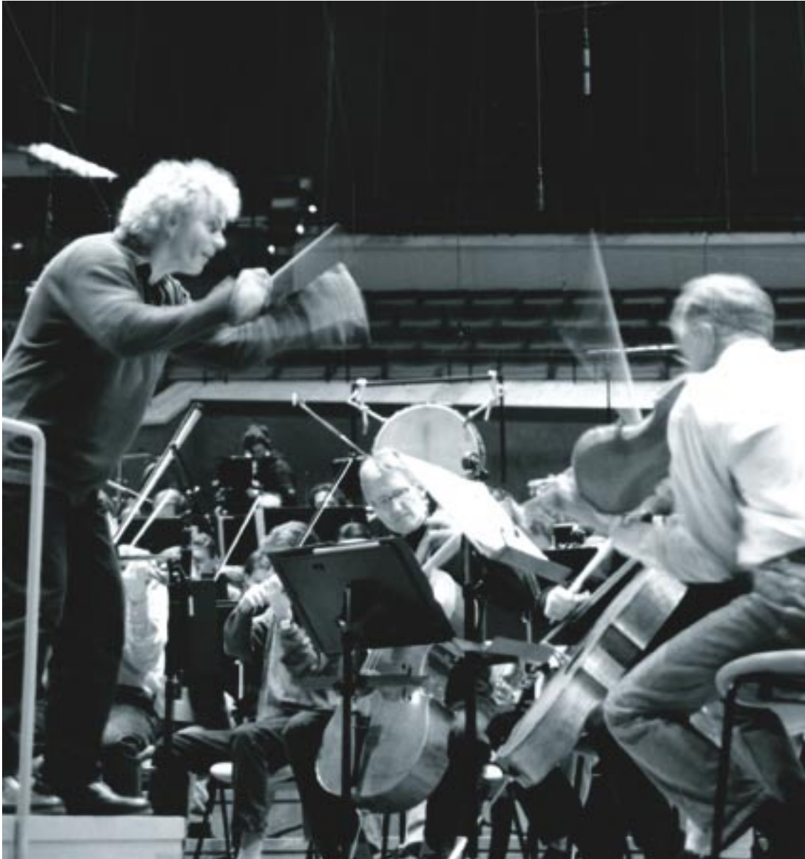
Sir Simon Rattle und die Berliner Philharmoniker, Orchesterprobe

„So, good morning. My one minute speech only, just to tell you what an unbelievable thing is going on. We have been making a dance company for young people. Aged from eight to early twenties. There are 250 of them, from every possible social class, every possible sex, all three. You name it, there are of all the – as I said – from eight to twenties, from Iraq, from Iran, from Russia, from Greece. Some Germans! From East and West Berlin, people who would never meet each other, people who would probably fight each other. I have to say, I've seen many dance productions of Sacre , but I've never seen anything like this. It's a really extraordinary thing and I'm so happy that we have the chance to do this. And it's a very big deal. So, let's play some music now!“