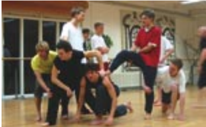
Tanzwerkstatt No Limit